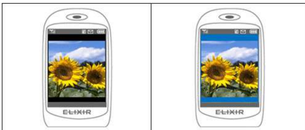
図 2-2. 待ち受け画像の余白背景色 デフォルト (黒) と 0000ff (青) の様子