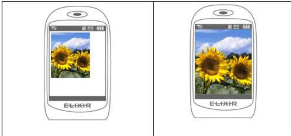
図 2-1. 待ち受け画像指定 デフォルト (OFF) と 1 (ON) の違い