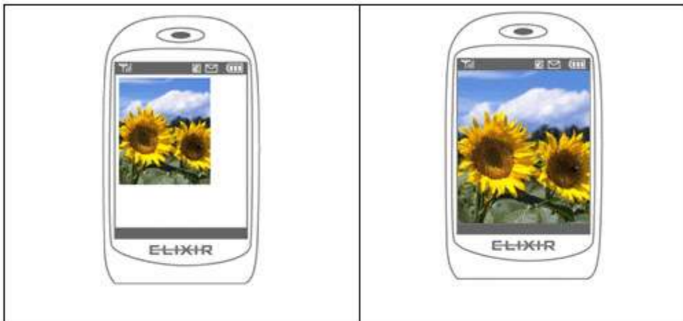
待ち受け画像指定 デフォルト (OFF) と 1 (ON) の違い